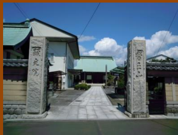
顕光院(重田家菩提寺)