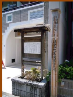
十辺舎一九生家案内